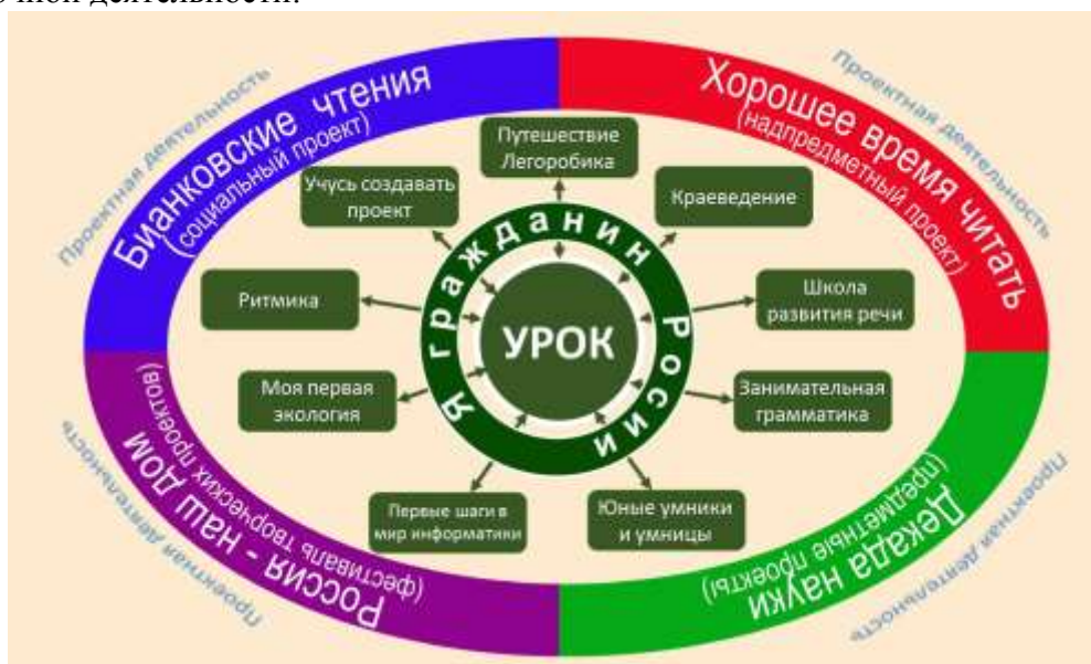
Модель «РОСТОК» 2015/16 уч.год

Технология проектирования является ведущей на занятиях по всем направлениям внеурочной деятельности: